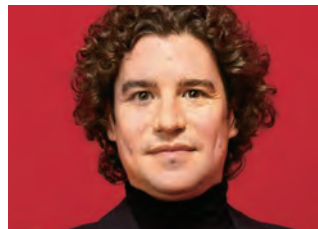
ロビン・ティチアーティ指揮 ベルリン・ドイツ交響楽団 Robin Ticciati, conductor Deutsches Symphonie-Orchester Berlin

現在最も注目と尊敬を集めているヴァイオリニストのひとり。1988年ユーロヴィジョン・ヤング・ミュージシャンズのグランプリ獲得をきっかけに、史上最年少のソリストとしてムーティ指揮ウィーン・フィルと共演。以来30年に亘り世界の著名指揮者、オーケストラと共演を重ねている。近年は指揮者としても活躍しており、現在ロイヤル・ノーザン・シンフォニアとトウルク・フィルハーモニー管弦楽団の首席客演指揮者を務めている。またバルマ・デ・マヨルカ(スペイン)でジュリアン・ラクリン&フレンズ・フェスティバルを開いている。本年の〈ARKクラシックス〉では、ヴァイオリン、ヴィオラ奏者として三浦文彰らと室内楽で共演するほか、ARKシンフォニエッタを指揮し、ヴィヴァルディとピアソラの《ふたつの四季》、モーツァルト:ディヴェルティメント K.136の指揮を務める。