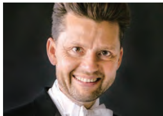
ジュリアン・ラクリン (指揮・ヴァイオリン・ヴィオラ) Julian Rachlin, conductor, violin, viola

現在最も注目と尊敬を集めているヴァイオリニストのひとり。1988年ユーロヴィジョン・ヤング・ミュージシャンズのグランプリ獲得をきっかけに、史上最年少のソリストとしてムーティ指揮ウィーン・フィルと共演。以来30年に亘り世界の著名指揮者、オーケストラと共演を重ねている。近年は指揮者としても活躍しており、現在ロイヤル・ノーザン・シンフォニアとトウルク・フィルハーモニー管弦楽団の首席客演指揮者を務めている。またバルマ・デ・マヨルカ(スペイン)でジュリアン・ラクリン&フレンズ・フェスティバルを開いている。本年の〈ARKクラシックス〉では、ヴァイオリン、ヴィオラ奏者として三浦文彰らと室内楽で共演するほか、ARKシンフォニエッタを指揮し、ヴィヴァルディとピアソラの《ふたつの四季》、モーツァルト:ディヴェルティメント K.136の指揮を務める。